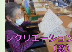
レクリエーション (歌)