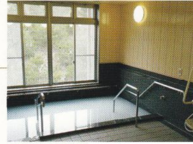
一般浴室 窓の外の緑を楽しみながらご入浴いただけます。