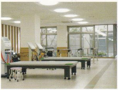
機能回復訓練室 充実した設備でリハビリを行うことができます。