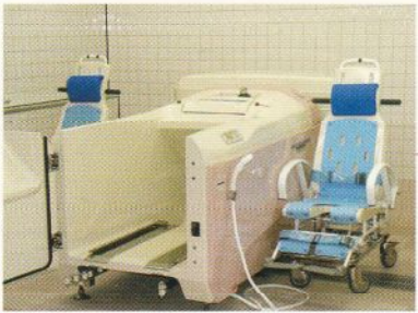
浴室機器 最新の設備で快適なご入浴をしていただけます。