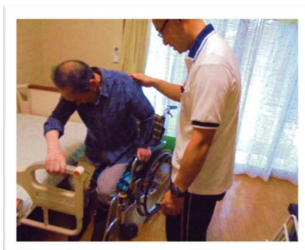
日常生活動作練習