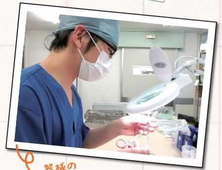
器械のメンテナンス