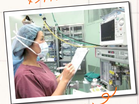
モニターから患者さんの状態を観察