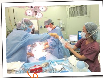
術中の介助のようす