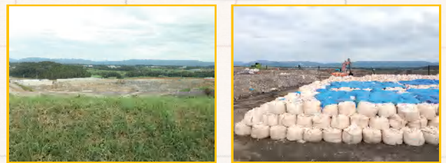
最終処分場(伊賀市内)で埋め立てられます。