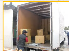
収集運搬業者が定期的に病院から搬出していきます。