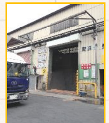
中間処理施設(伊賀市内)で焼却されます。