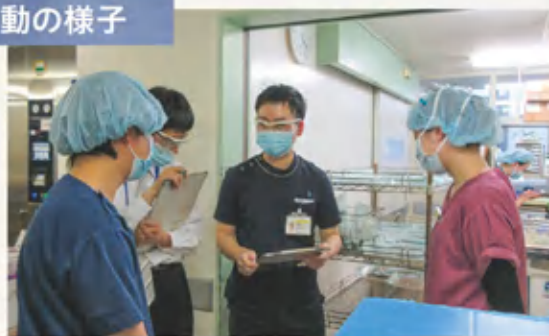
職員への職場環境に関するヒアリング