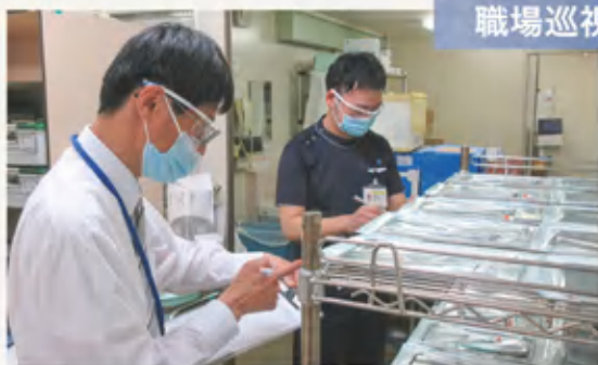
部署内における労災リスクの有無等を確認