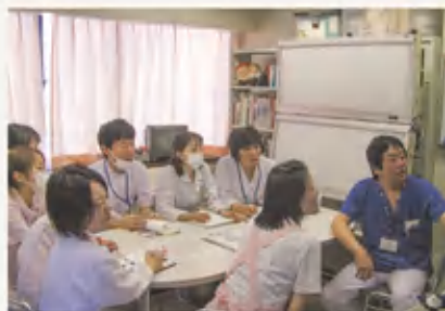
カンファレンスの様子

これからも当院褥瘡対策委員会は多職種で連携し、院内院外問わず褥瘡の予防と治療にあたっていきます。たった1人で介護されている方もみえるでしょうが、不安に思われるようなことがあれば、まずご相談ください。