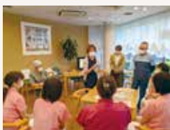
基礎知識(座学)を伝える様子