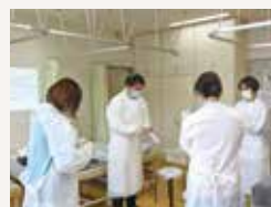
ガウンや手袋の着脱練習