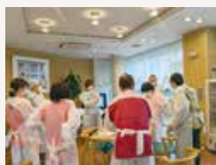
分娩時の感染対策を検討